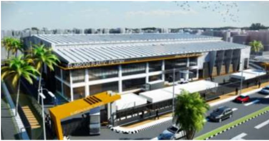
El Morooj Plastic Factory Jeddah – Industrial City 3 Building Area : 5,842 m 2 Design & Supervision

كي جي ال لوجستيك جدة – المدينة الصناعية الثالثة مساحة البناء : 199.998 م 2 تصميم وإشراف