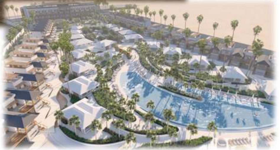
Silver Sands Resort (Obhur) – Permits & Supervision