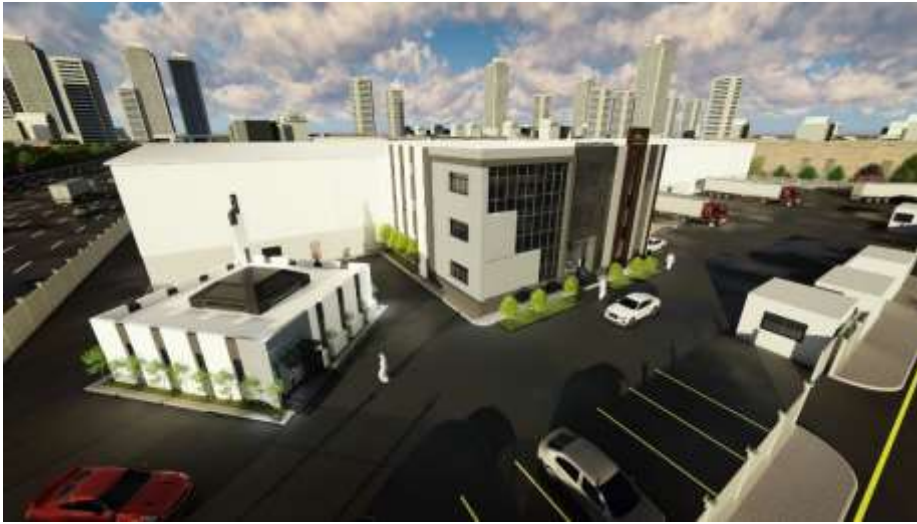
Najm Shada Co. Ltd. Jeddah – Industrial City 3 Building Area : 6,135 m 2 Design & Supervision

شركة المتين الدولية للصناعات البلاستيكية جدة – المدينة الصناعية الثانية مساحة البناء : 14,523م 2 تصميم وإشراف