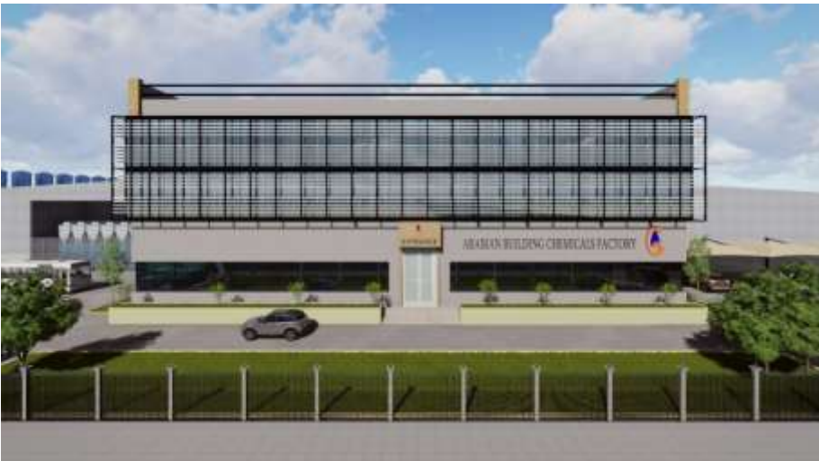
Arabian Building Chemicals Factory Jeddah – Industrial City 3 Building Area : 18,075 m 2 Design & Supervision

مصنع الشركة العربية لخيرات البحار جدة – المدينة الصناعية الأولى مساحة البناء : 3,264 م 2 تصميم وإشراف