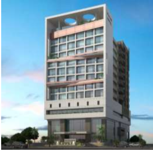
Hotel Ali Hayyas Al Zahrani Jeddah – Al Madina Road Building Area : 1,500 m 2 Design & Supervision

فندق علي هياس الزهراني جدة – طريق المدينة مساحة البناء : 1,500 م 2 تصميم وإشراف