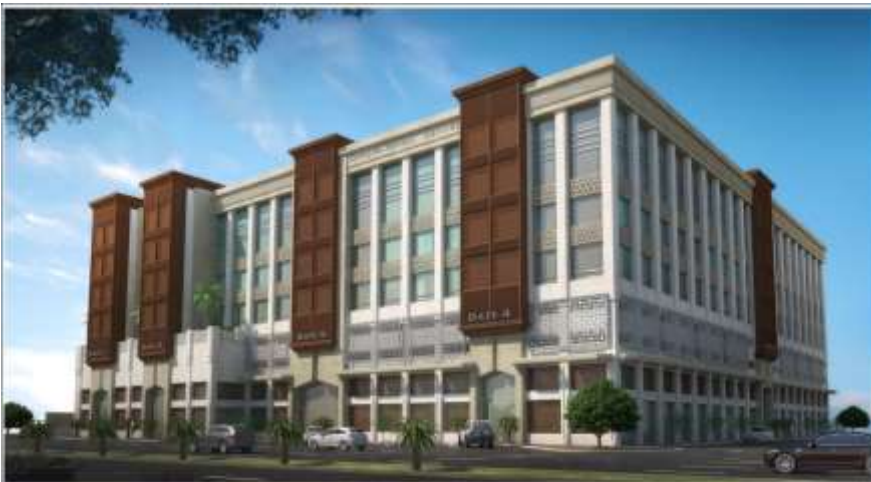
Al Rowashed Commercial Center Jeddah – Al Corniche Building Area : 6,500 m 2 Design & Supervision

فندق بن يعلا ال يعلا جدة – طريق المكرونة مساحة البناء : 1,650 م 2 تصميم وإشراف