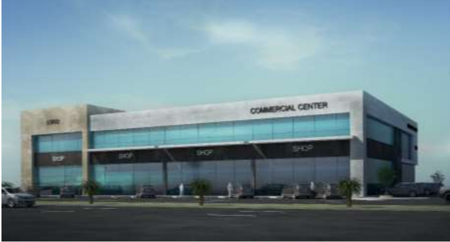
Kharsan Yoala Commercial Center Jeddah – Macarona Street Building Area : 4,850 m 2 Design & Supervision

فندق علي هياس الزهراني جدة – شارع التحلية مساحة البناء : 22,000 م 2 تصميم وإشراف