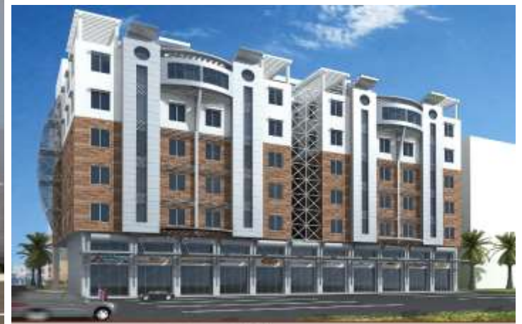
Gazzaz - Residential Building

MASS ADVANCED CONSULTING ENGINEERS S.A.L. 1226 License No. 1226 مكتب المهندس حسين حسن بياري للإستشارات الهندسية ترخيص رقم 1226