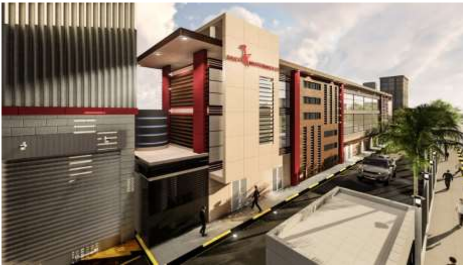
Saudi Master baker LTD Jeddah – Industrial City 1 Building Area : 4,418 m 2 Design & Supervision

مصنع محمود سعيد للصناعات الحديدية جدة – المدينة الصناعية الثالثة مساحة البناء : 206,657 م 2 تصميم وإشراف