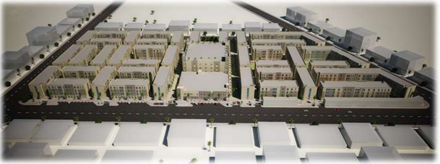
Al Rajhi Labor Accomodation – Permits, Design & Supervision