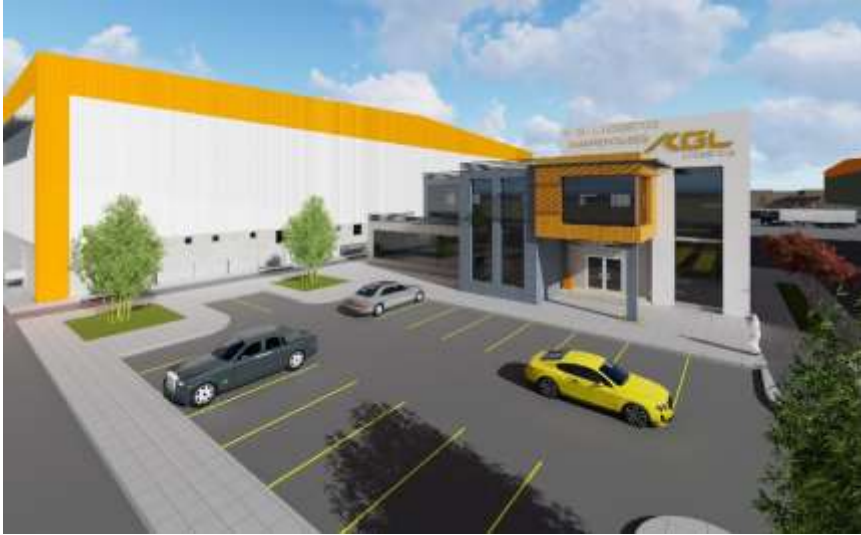
KGL Logistics Factory Jeddah – Industrial City 3 Building Area : 199,998 m 2 Design & Supervision

كي جي ال لوجستيك جدة – المدينة الصناعية الثالثة مساحة البناء : 199.998 م 2 تصميم وإشراف