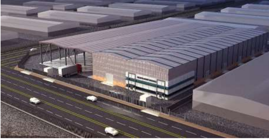
Nesma – Marble Factory Jeddah – Industrial City 3 Building Area : 19,644 m 2 Design

مصنع شركة نسما المدار للرخام جدة – المدينة الصناعية الثالثة مساحة البناء : 19,644 م 2 تصميم