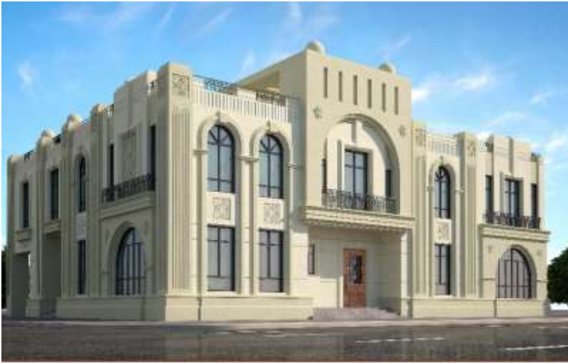
MASS ADVANCED CONSULTING ENGINEERS S.A.L. مكتب المهندس حسين حسن بياري للإستشارات الهندسية