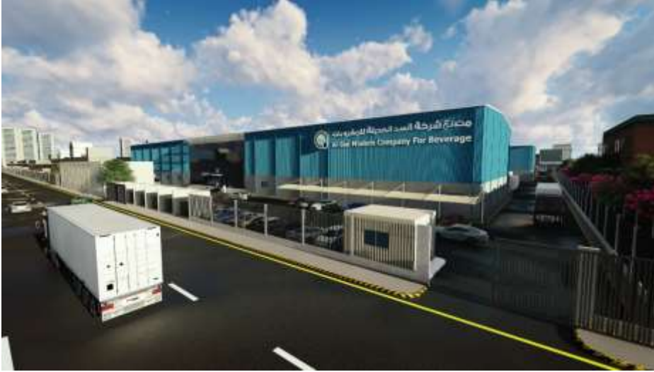
Al-Sad Modern Company for Beverage Jeddah – Industrial City 3 Building Area : 12,515 m 2 Design & Supervision

مصنع شركة السد الحديثة للمشروبات جدة – المدينة الصناعية الثالثة مساحة البناء : 12,515 م 2 تصميم وإشراف