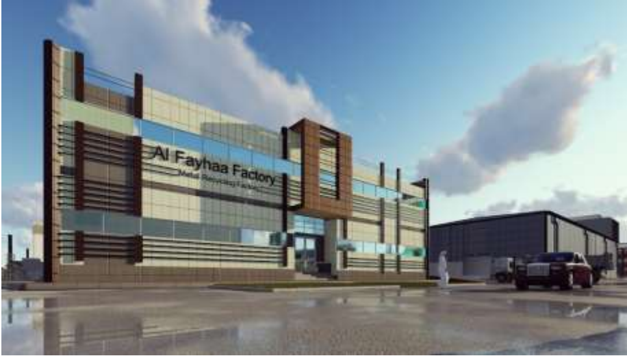
Al Fayhaa Factory – Metal Recycling Factory Jeddah – Industrial City 3 Building Area : 27,539 m 2 Design & Supervision

مصنع شركة الفيحاء الدولية لتدوير المعادن جدة – المدينة الصناعية الثالثة مساحة البناء : 27,539 م 2 تصميم وإشراف