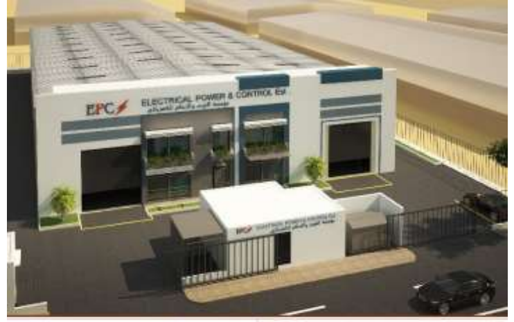
MASS ADVANCED CONSULTING ENGINEERS S.A.L. 1226 مكتب المهندس حسين حسن بياري للإستشارات الهندسية ترخيص رقم 1226