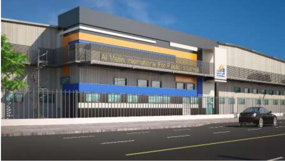
Al Matin International for Plastic Industries Jeddah – Industrial City 2 Building Area : 14,523 m 2 Design & Supervision

شركة المتين الدولية للصناعات البلاستيكية جدة – المدينة الصناعية الثانية مساحة البناء : 14,523م 2 تصميم وإشراف