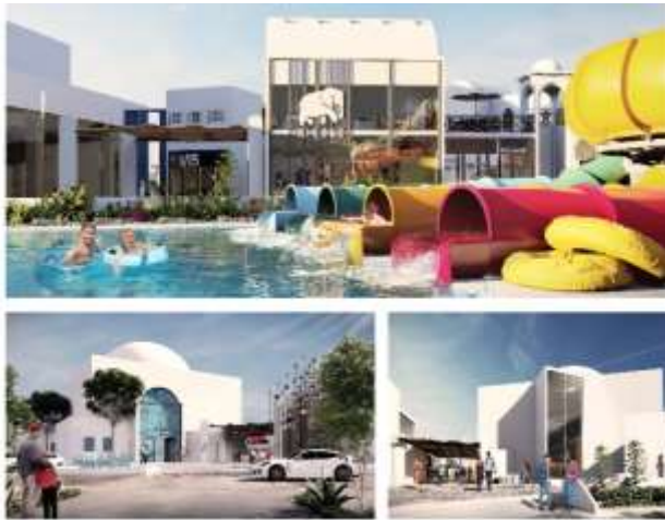
مشروع المنتجع المائي جدة - ابحر مساحة البناء : 100,000 م 2 رخص و إشراف