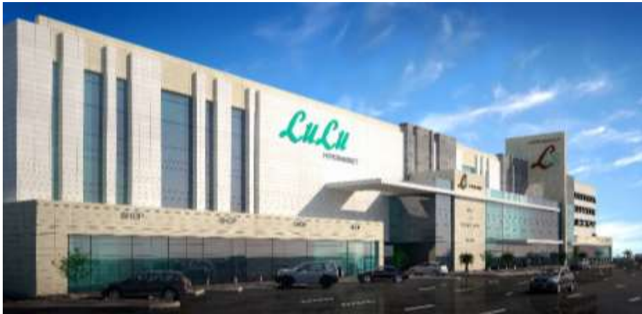
Lulu HyperMarket Jeddah – Al Madina Road Building Area : 20,000 m 2 Design & Supervision

مركز تجاري خرسان يعلا جدة – شارع المكرونة مساحة البناء : 4,850 م 2 تصميم وإشراف