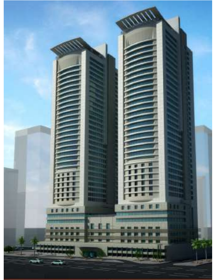
MASS ADVANCED CONSULTING ENGINEERS S.A.L. مكتب المهندس حسين حسن بياري للإستشارات الهندسية