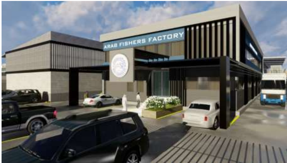
Arab Fishers Factory Jeddah – Industrial City Building Area : 3,264 m 2 Design & Supervision

مصنع شركة السد الحديثة للمشروبات جدة – المدينة الصناعية الثالثة مساحة البناء : 12,515 م 2 تصميم وإشراف