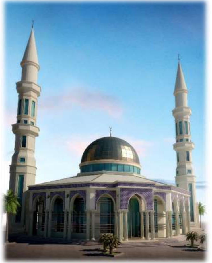
Al Taher Mosque – Permit, Design & Supervision