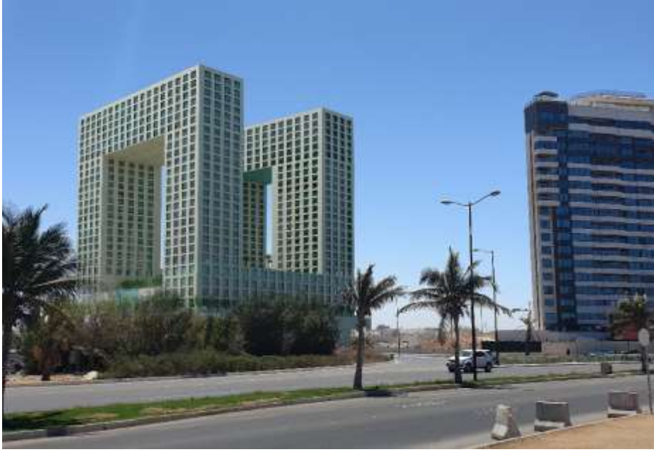
Four Seasons Hotel Jeddah Sari Street Building Area: 18,786 m 2 Supervision