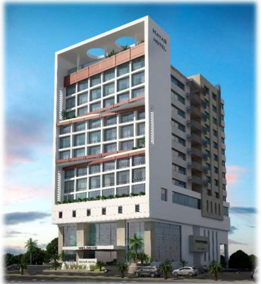
Karam Hotel – Permits, Design & Supervision