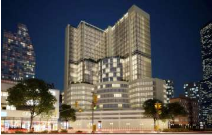
MASS ADVANCED CONSULTING ENGINEERS S.A.L. 1226 مكتب المهندس حسين حسن بياري للإستشارات الهندسية ترخيص رقم 1226