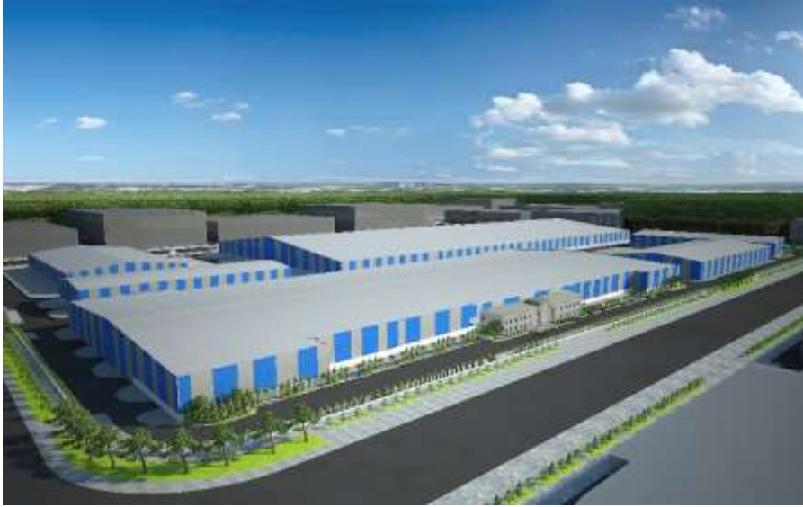
Mahmoud Saeed Metal Factory Jeddah – Industrial City 3 Building Area : 206,657 m 2 Design & Supervision

مصنع شركة الخياط لأشرطة التريط البلاستيكية المحدودة جدة – المدينة الصناعية الثالثة مساحة البناء : 9,113 م 2 تصميم وإشراف