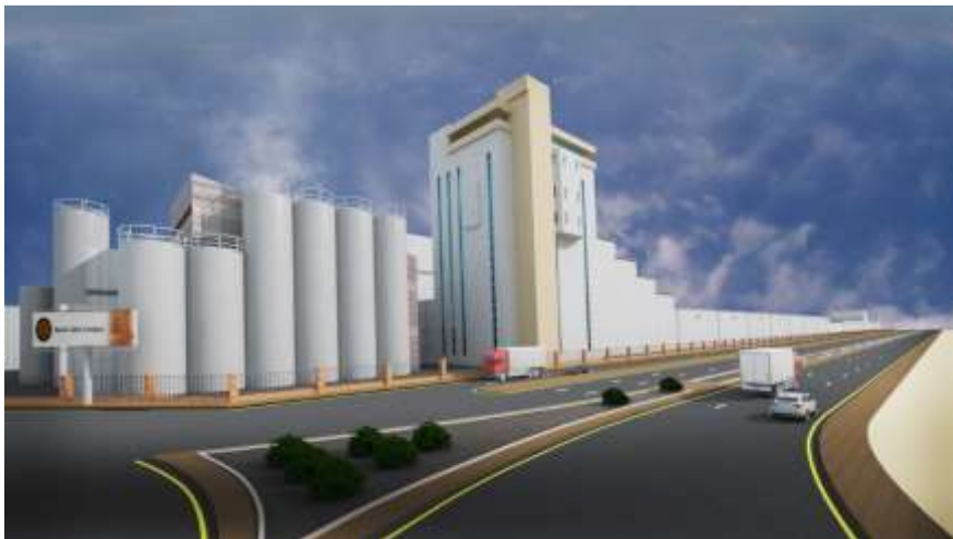
Saudi Cable Factory Jeddah – Industrial City 1 Building Area : 125,977 m 2 Design

مصنع شركة المروج للبلاستيك جدة – المدينة الصناعية الثالثة مساحة البناء : 5,748 م 2 تصميم وإشراف