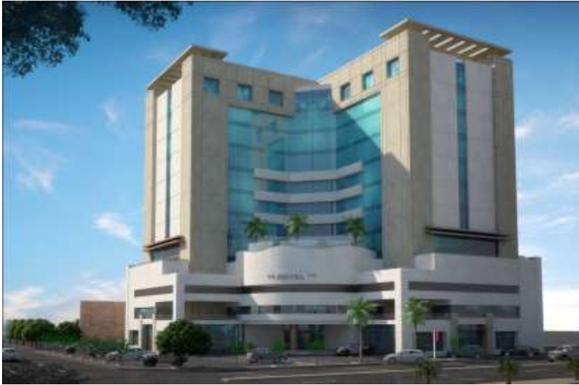
Hotel Bin Yoala Al Yoala Jeddah – Al Macarona Street Building Area : 1,650 m 2 Design

فندق علي هياس الزهراني جدة – طريق المدينة مساحة البناء : 1,500 م 2 تصميم وإشراف