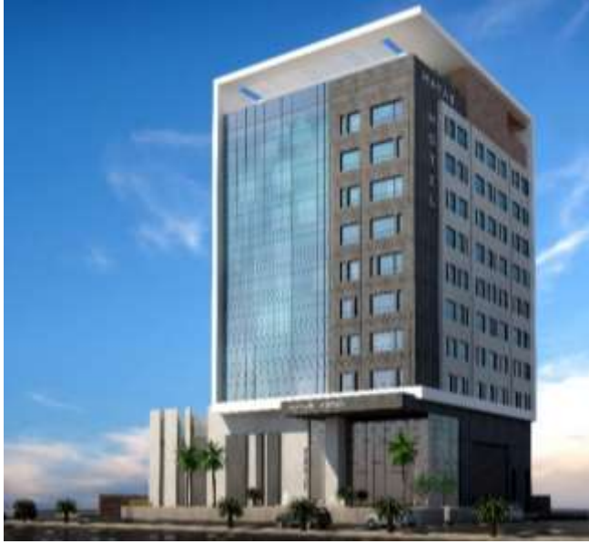
Hotel Ali Hayas Al Zahrani Jeddah – Al Tahlia Building Area : 22,000 m 2 Design & Supervision

فندق علي هياس الزهراني جدة – شارع التحلية مساحة البناء : 22,000 م 2 تصميم وإشراف