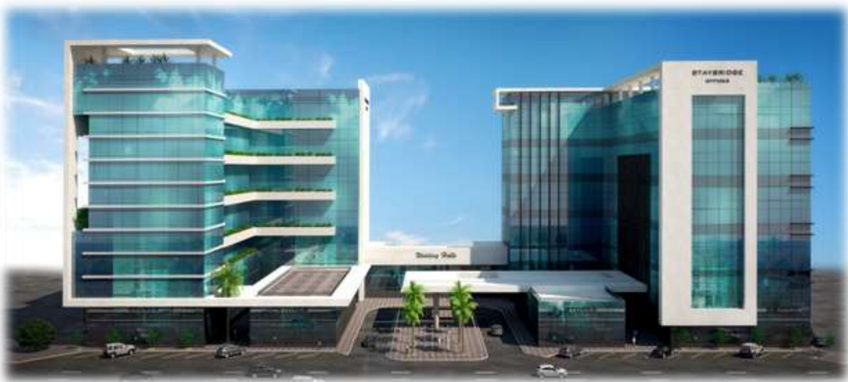
Staybridge Offices – Permits