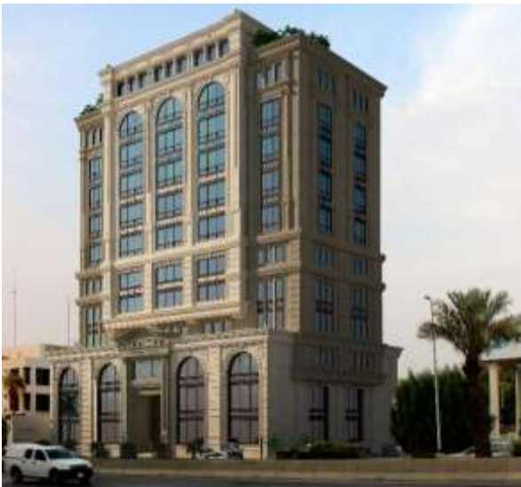
Ahmad Ba Sameeh Commercial Center Jeddah – Al Madina Road Building Area : 20,000 m 2 Design & Supervision

مصنع شركة المروج للحديد و الصناعات المعدنية جدة – المدينة الصناعية الثالثة مساحة البناء : 15,448 م 2 تصميم