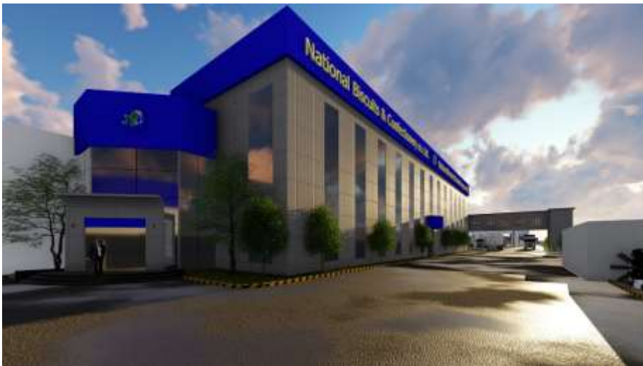
National Biscuits & Confectionery Co. Ltd. Jeddah – Industrial City 1 Building Area : 36,345 m 2 Design & Supervision

مصنع شركة نجم شدا للصناعات المعدنية جدة – المدينة الصناعية الثالثة مساحة البناء : 6,135م 2 تصميم وإشراف