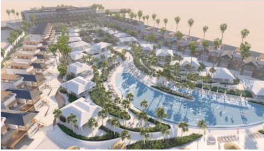
Silver Sands Beach Resort Jeddah Obhur Supervision & Permits