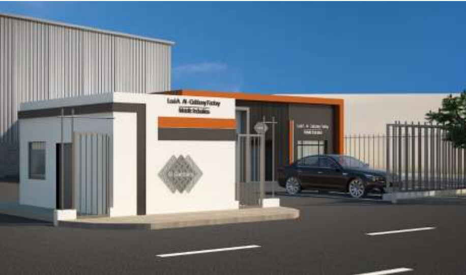
Loai A. Al-Gabbany Factory – Metallic Industries Jeddah – Industrial City 3 Building Area : 4,806 m 2 Design & Supervision

مصنع شركة الفيحاء الدولية لتدوير المعادن جدة – المدينة الصناعية الثالثة مساحة البناء : 27,539 م 2 تصميم وإشراف