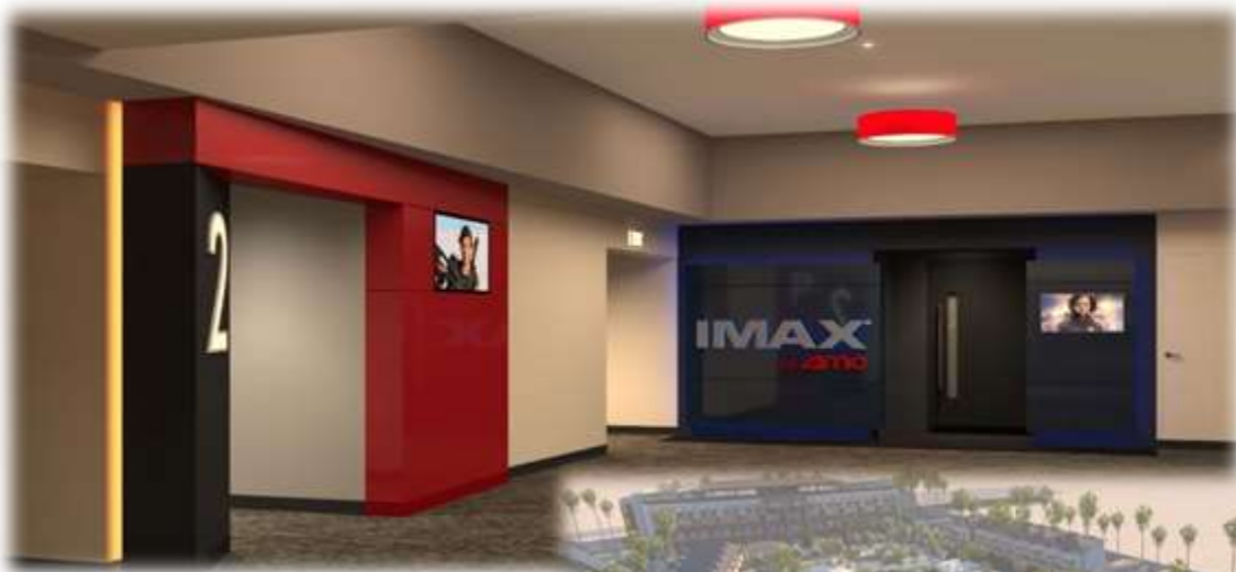
Stars Avenue Mall (Princess Sultan Street), AMC Cinema – Supervision

MASS Advanced Consulting Engineers s.a.l., founded in 1981, is a multidisciplinary engineering and architectural consulting company qualified in Jeddah Municipality (AMANA), Saudi Industrial Property Authority (MODON), Ministry of Housing and King Abdullah Economic City (KAEC). Large numbers of projects ranging in commercial, retail, industrial, and special structures have been successfully completed, on time and within budget. We are committed to make sure that you are pleased with the result no matter how small or large your project is. MASS services are all in-house, covering a broad spectrum from architecture to construction and management projects. MASS Advanced Consulting Engineers s.a.l. currently operates in Jeddah, Saudi Arabia, covering projects all around the middle-east. We are ranked among AMANA's Top 5 engineering consulting companies in Jeddah and Western Region.