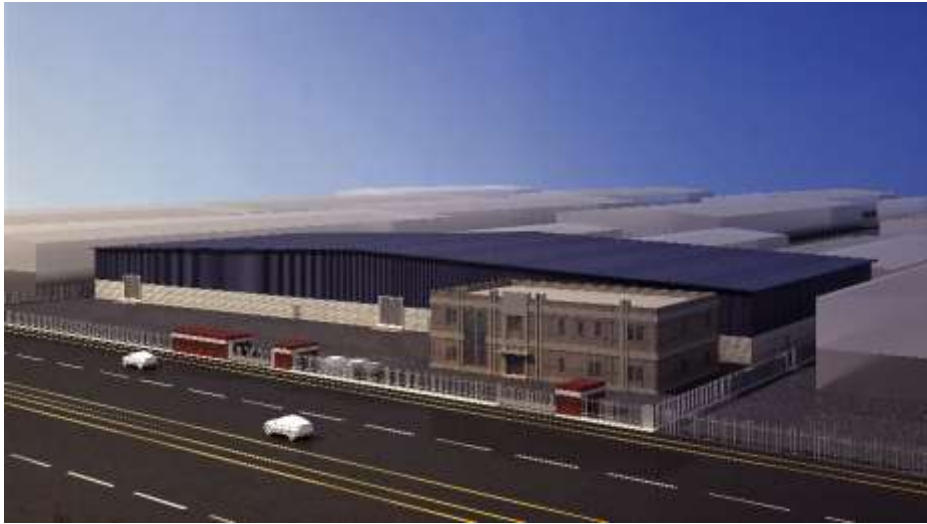
El Morooj Steel Factory Jeddah – Industrial City 3 Building Area : 15,448 m 2 Design

مصنع شركة نسما المدار للرخام جدة – المدينة الصناعية الثالثة مساحة البناء : 19,644 م 2 تصميم