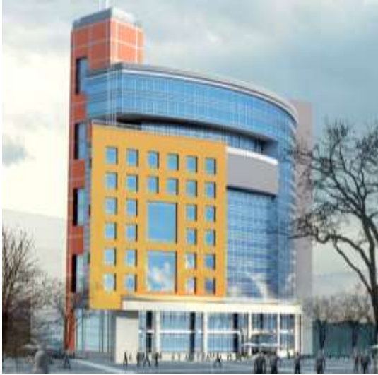
Middle East Newspaper – Head Office Jeddah Design