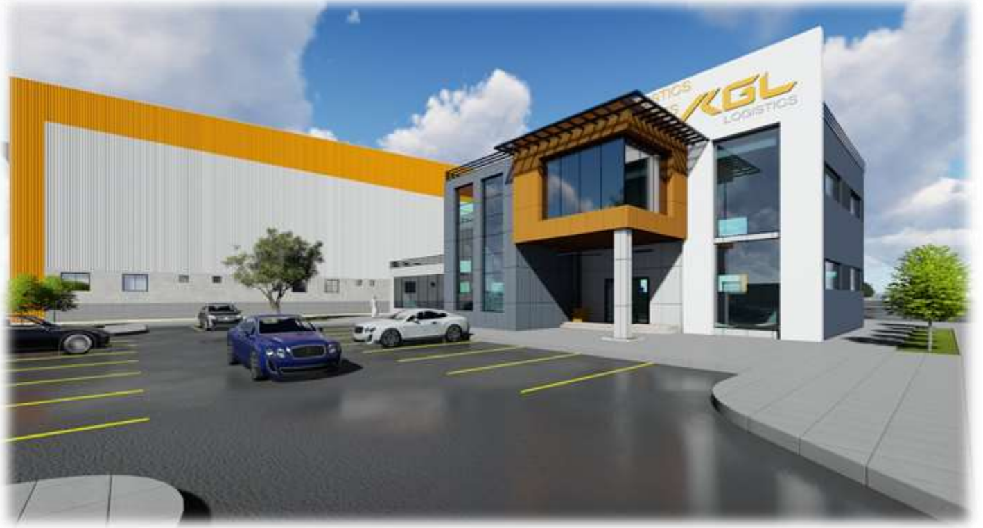
KGL Logistics Warehouse – Permits, Design & Supervision