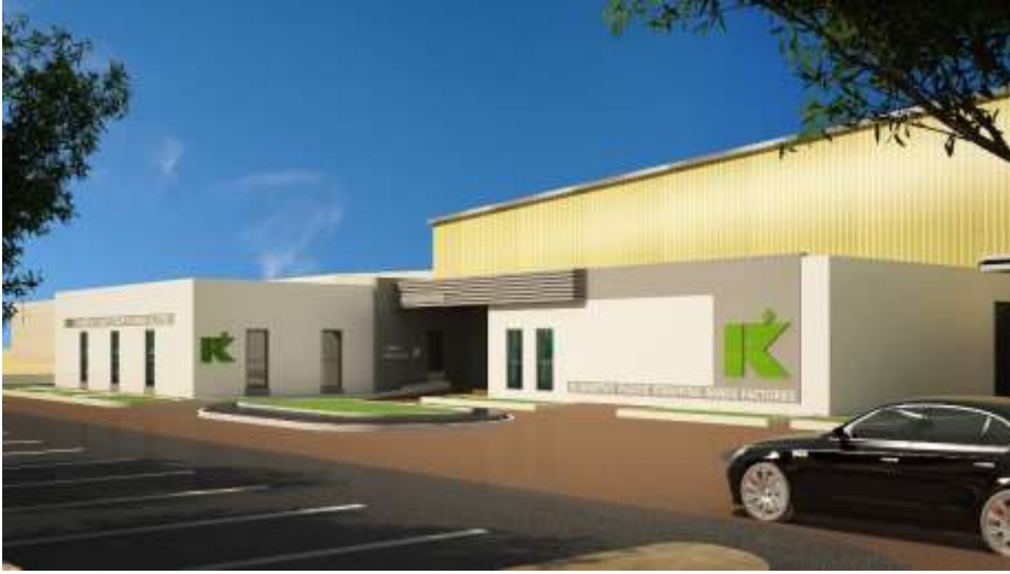
El Khayat Plastic Strapping bands factories Jeddah – Industrial City 3 Building Area : 9,113 m 2 Design & Supervision

مصنع شركة الخياط لأشرطة التريط البلاستيكية المحدودة جدة – المدينة الصناعية الثالثة مساحة البناء : 9,113 م 2 تصميم وإشراف