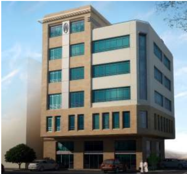
Issam Al Gazzaz Center Jeddah – Sari Road Design & Supervision

مركز عصام الغزاز جدة – شارع صاري تصميم و إشراف