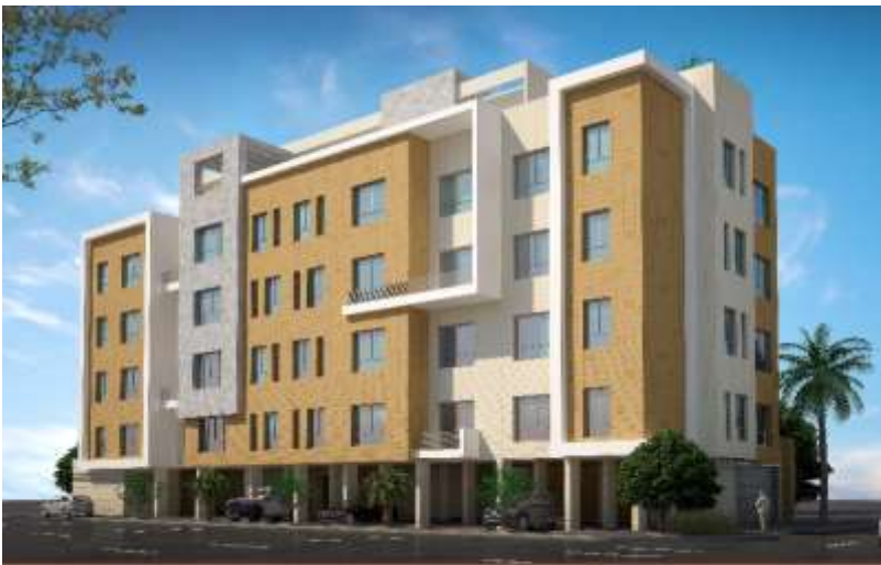
MASS ADVANCED CONSULTING ENGINEERS S.A.L. مكتب المهندس حسين حسن بياري للإستشارات الهندسية