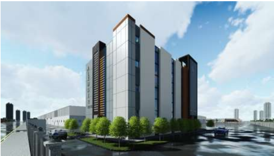
Al Khair Metal Factory Jeddah – Industrial City 3 Building Area : 36,613 m 2 Design & Supervision

مصنع لؤى عبد الرازق القباني للصناعات المعدنية جدة – المدينة الصناعية الثالثة مساحة البناء : 4,806 م 2 تصميم وإشراف